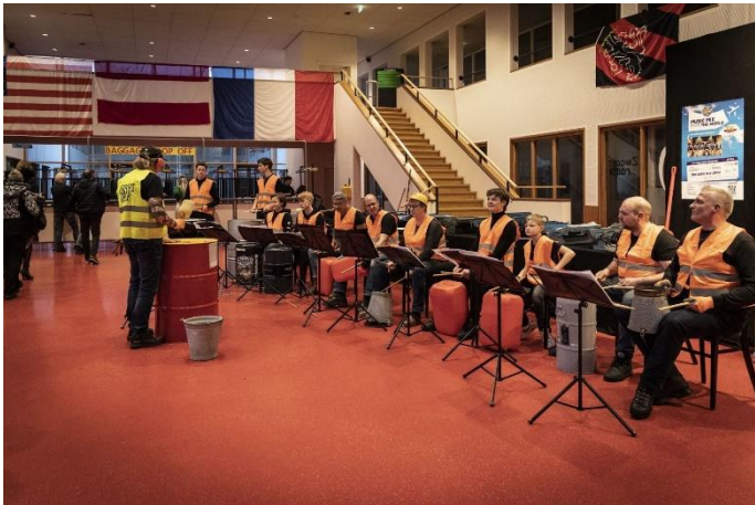
Onze slagwerkers in actie tijdens de inloop van het 100-jarig jubileumconcert van Ons Genoegen in Wognum op 25 maart jl.

Onze slagwerkgroep is een samenwerking aangegaan met de (overgebleven) slagwerkers van Muziekvereniging Ons Genoegen uit Wognum. Gewoon, omdat het leuker is met een grotere groep te trommelen en er meer mogelijk is. De ene week repeteren ze in Wognum, de andere week in Wervershoof. De complete groep zal ook op het voorjaarsconcert acte de presence geven, waaronder met een ritme uit de feestelijke Braziliaanse keuken en met het ludieke optreden van de foto hierboven. Ook zal de fanfare mooie concertstukken spelen. In de pauze houden we een verloting met mooie prijzen. We hopen u te zien op zaterdagavond 22 april in De Schoof! Aanvang 20.00 uur, vrij entree.