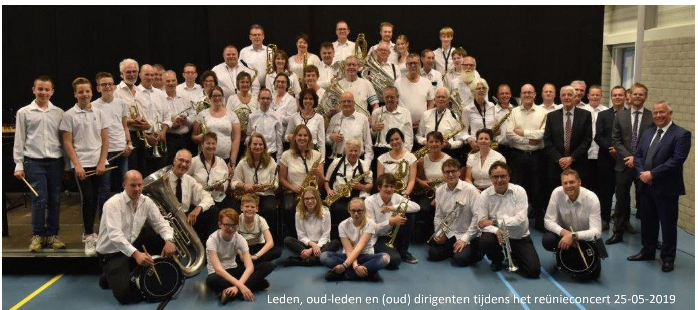
Leden, oud-leden en (oud) dirigenten tijdens het reünieconcert 25-05-2019