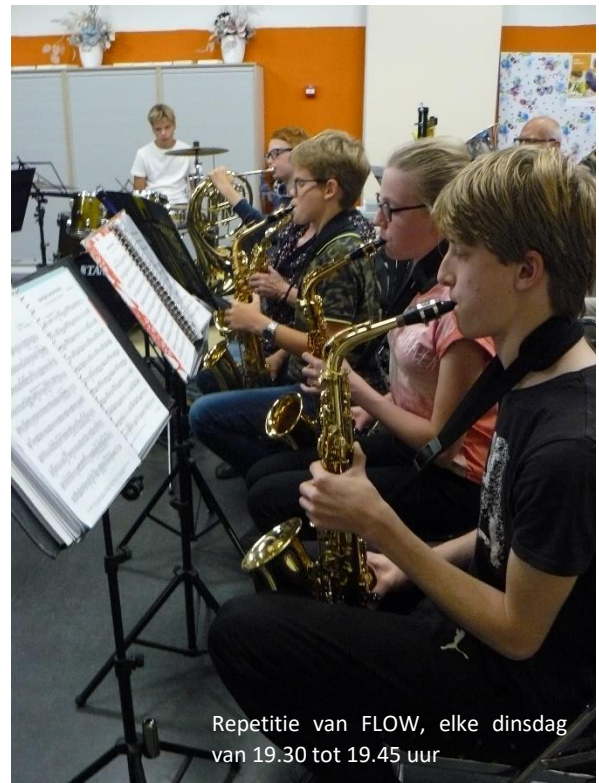
Repetitie van FLOW, elke dinsdag van 19.30 tot 19.45 uur